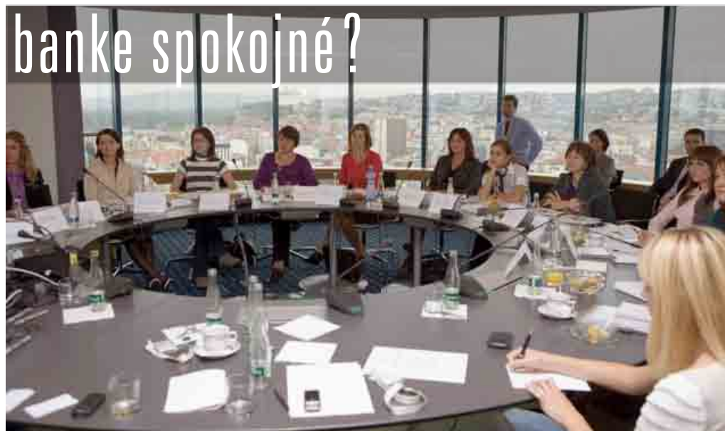
Prieskum spokojnosti vo VÚB banke riešil aj postavenie matiek s maloletými deťmi a žien vo veku 50+.

Po prvom kole prieskumu zaviedla banka nové opatrenia. Najlepšie