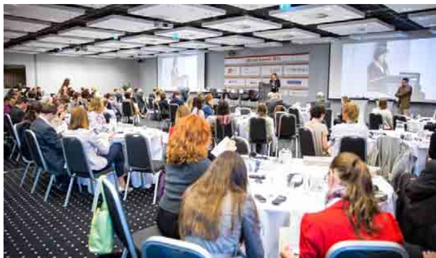
Z hotela sa tento rok summit presunie do inšpiratívneho priestoru bratislavskej Starej Tržnice.