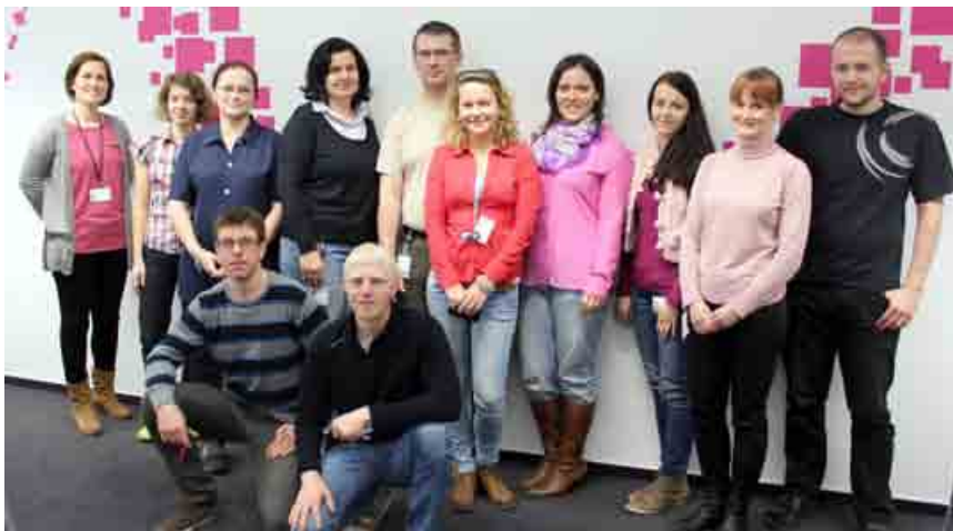
V T-Systems Slovakia funguje až deväť dobrovoľníckych tímov, ktoré sa venujú rôznym oblastiam.

Vo februári tohto roka dosiahol počet zamestnancov v T-Systems Slovakia číslo 3 000. Ako sa hovorí, koľko ľudí, toľko chutí. Platí to aj v dobrovoľní-