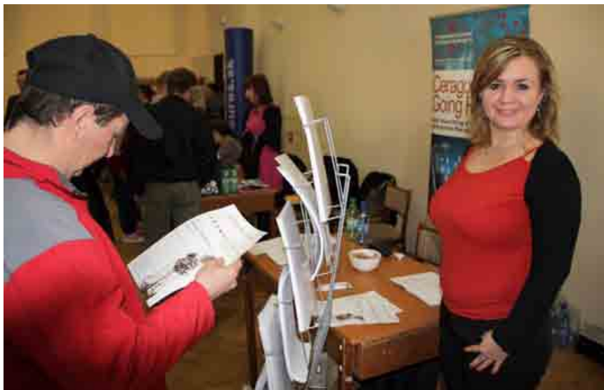
Prvý Flexi Liptov Job Day prepojil firmy a vzdelávacie inštitúcie so záujemcami o prácu či štúdium v regióne Liptova.

V marci sa v Liptovskom Hrádku konal prvý ročník podujatia Flexi Liptov Job Day. Spolu 25 firiem a vzdelávacích inštitúcií ponúkalo záujemcom prácu ale aj štúdium v regióne.