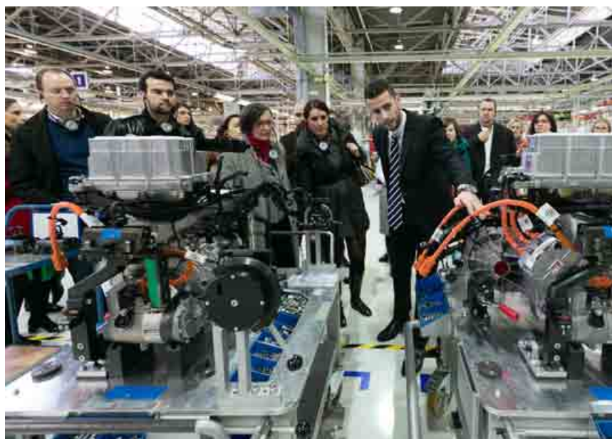
Členovia Business Leaders Forum si v marci prehladli aj výrobné priestory automobilky Volkswagen Slovakia.

V bratislavskom regióne Volkswagen prispieva k rozvoju bežeckej infraštruktúry a podporuje tiež unikátny projekt chovu a vypúšťania rakov do voľnej prírody. «