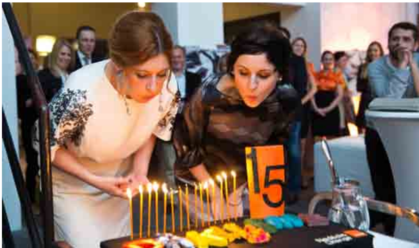
Nadácia Orange, ktorá podporuje aktivity v oblasti vzdelávania, sociálnej inklúzie a komunitného rozvoja, oslávila 15. narodeniny.

Nadácia Orange už 15 rokov pomáha zlepšovať život jednotlivcov i komunit a podporuje aktivity v oblasti vzdelávania, sociálnej inklúzie a komunitného rozvoja. Od svojho vzniku podporila