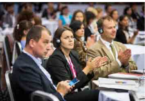
Na podujatí sa aj tento rok predstavia príklady úspešného zodpovedného podnikania z domova i zo sveta.